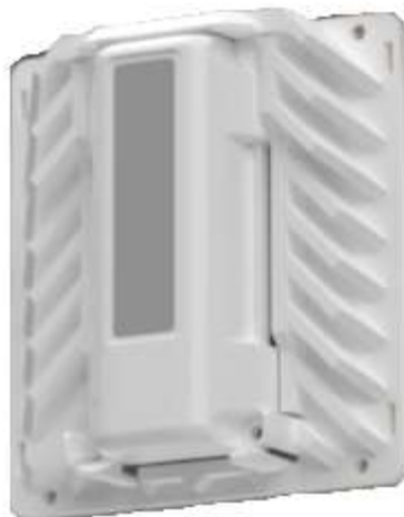
Figura 1 - Sensor para Detecção e Indicação de Operação (Imagem ilustrativa)